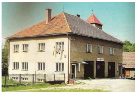
Budova bývalého obecného úradu.