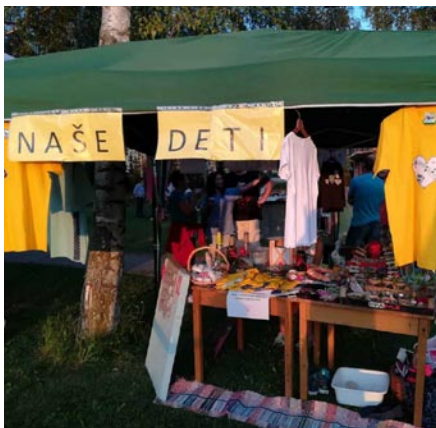
Stánok s výrobkami.