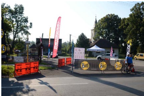
Na štarte duatlonu.

nemusíme báť, že by sme nemali čo jesť. Žiť sa dá aj bez prílišnej chemizácie, nadmernej ťažby surovín a tým aj obrovského plytvania so zdrojmi a cez hlavu prerastajúcou produkciou odpadu. Relatívne lacné potraviny vyvolávajú podľa britských odborníkov tzv. epidémiu obezity. Vysoké percento populácie s nadmernou hmotnosťou v Európe sa nám už javí ako samozrejmosť. Zanecháme po nás potopu, či skôr púšť alebo dobré, príjemné a dôstojné miesto pre život? Všade počujeme, že prílišné zameralenie sa na materiálnu stránku života rýchlo vyčerpáva zdroje planéty. Lesy sa zmenšujú, mnohé živočíšne druhy sú na pokraji vyhynutia. Legendárna Einsteinova veta o tom, čo nás čaká po vyhynutí obyčajných včiel, by nám mohla a mala byť mementom v prehodnotení si priorit.