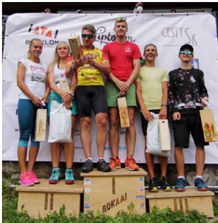
Vítazi duatlonu - domáce družstvá.

- 21. júla sa konal už 21. ročník zábavy v prírode, ktorú zorganizovali Smrečianski záhradkári, hostia sa mohli zabaviť s hudobnou skupinou Flash, vidieť vystúpenie domácej folklórnej skupiny, vyhrať vecné ceny v tombole alebo ochutnať guláš.