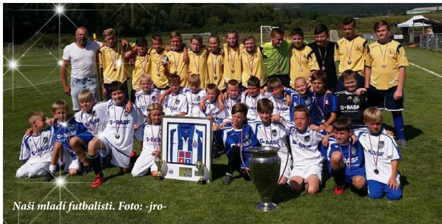
Naši mladí futbalisti.