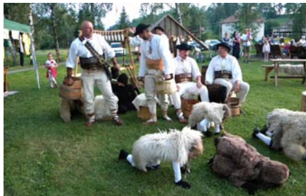
Vystúpenie na Záhradkárskej zábave.