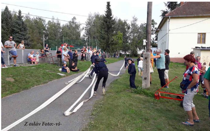
Z osláv

Po dvoch týždňoch sa aj v našej obci organizovali oslavy 130. výročia založenia hasičského spolku. Oslavy sa uskutočnili dňa 01.09.2018. Osláv sa zúčastnili aj funkcionári zo Štátnej správy, Krajskej organizácie DHZ a Okresných organizácií hasičov. Pri tejto príležitosti, bola nášmu spolku odovzdaná čestná zástava, ktorá je druhým najväčším vyznamenaním pre dobrovoľný hasičský spolok. Za dlhodobú prikladnú prácu boli ocenení aj