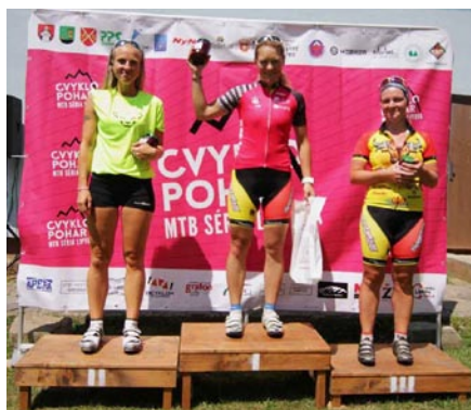
Vítazky Cvyklo pohára

TJ Družba Smrečany-Žiar Turistický klub organizuje 31. ročník výstupu na Plačlivô , ktorý sa uskutoční 7. októbra 2018. Stretnutie na Plačlivom o 11:00 hod. Pre účastníkov výstupu bude pripravený guláš na Žiarskej chate.