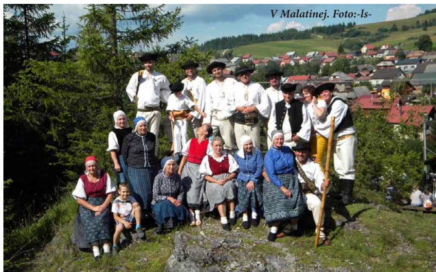
V Malatinej.