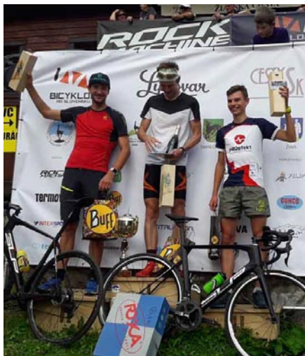
Vítazi duatlonu - jednotlivci muži.