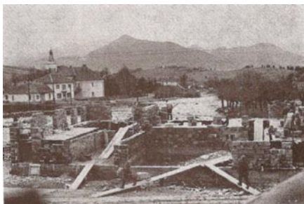
Výstava novej požiarnej zbrojnice 1958.