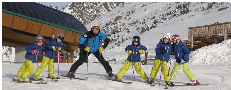
Najmladší pretekári s trénerom.