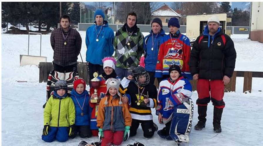
Z hokejového turnaja.

Komisia pre kultúru a šport pri OZ pozýva všetky matky, staré matky a ostatných spoluobčanov na slávnostný program ku Dňu matiek, ktorý sa uskutoční v nedeľu 8. mája o 15.00 v kultúrnom dome v Smrečanoch. V programe „Aká matka – taká Katka“ vystúpia deti z MŠ, folklórny súbor Smrečianik a mládež.