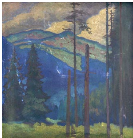
Smrečianska dolina. Peter Július Kern, Slovenská národná galéria

Priznám sa, že nie som veľkým zástancom premenovávaní zaužívaných vecí, asi ako väčšina ľudí. Pri vzrastajúcej hystérii a „vedeckých“ mýtoch typu – „Smrečianka je Smrečiankou preto, lebo vyviera pod Smrekom“ alebo „nech si Poliaci urobí poriadok vo svojich mapách“ - som rád, že sa dajú dokopy relevantné dôkazy, že všetko bolo trochu inak a pravda je niekde uprostred. Tá druhá strana totiž môže