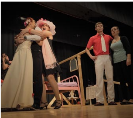
• Dokonalá svadba.

.....na tom vyšnom konci, u Kubov v plevienci. Dňa 13.marca 2016 - na Smrtnú nedeľu, folklórne deti spevom, hre na flautách našich dievčat a podpore rodičov i členov folklórnej skupiny zo Smrečian, sme vynášali Morenu- Marmurienu. Už v dávnej minulosti ľudia verili, že zneškodnením Moreny- slamenej figuríny, vy-