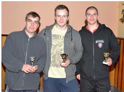
Vítazní pin-pongisti.