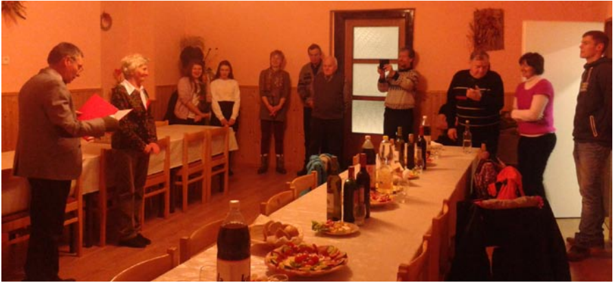
Oslava režisérky s divadelníkmi.

lepší (podľa odbornej poroty), a že máme veľký predpoklad hrať súčasné moderné hry (tiež to tvrdí porota). Ochotnícke divadlo nám opäť prinieslo aj krásne zážitky na turné v Pribyline, kde sme v priateľskej atmosfére zahrali Dokonalú svadbu pred viac ako dvesto divákmi. Zatiaľ posledné predstavenie sme odohrali v rámci regionálnej prehliadky ochotníckych divadiel doma – v Smrečanoch.