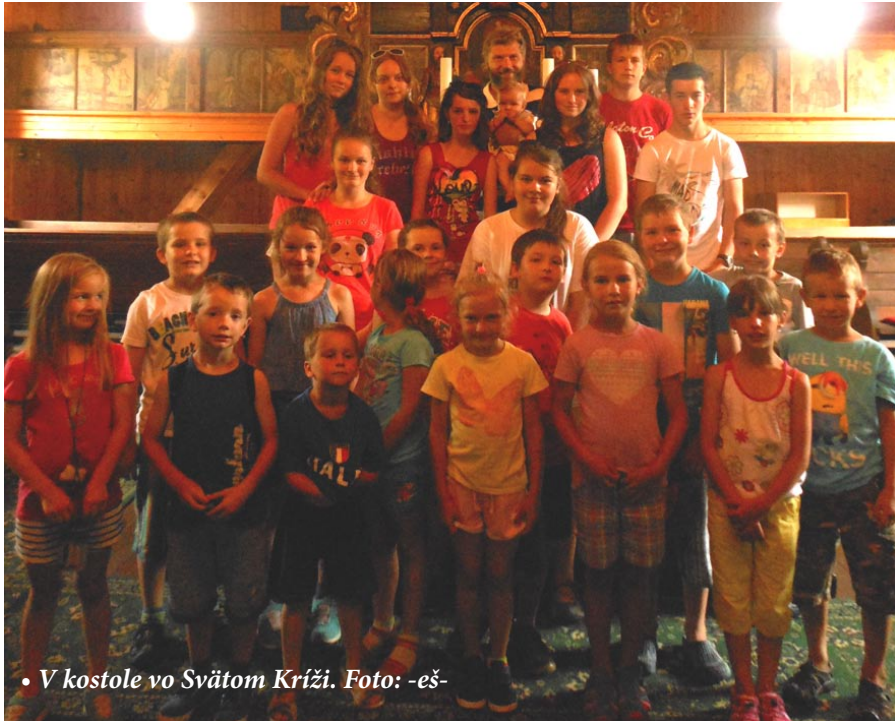
• V kostole vo Svätom Kríži. Foto: -eš-

je v kostole zobrazený dvakrát, raz ako plastika na oltári a druhýkrát namalovaný na chóre. Navštívili sme aj synagógu v Liptovskom Mikuláši, kde sme Desatoro videli napísané aj hebrejským písmom. Ďalší deň sme mali exkurziu na družstve, lebo sme „zbierali Mannu na púšti“ a vysvetľovali sme si, ako je dôležité ďakovať za úrodu, ďakovať za to, že máme čo jesť. Juj, deťom sa veľmi páčilo, že si môžu vyskúšať kombajn, posadiť sa do traktora, vidieť pílu. Bol to ďalší deň plný zážitkov. Už sme skoro na konci nášho bádania a skúmania, prišiel piatok a s ním i spojený výlet do Liptovského Jána. Z rozhľadne sme sa kochali výhľadom na náš milovaný Liptov. V podzemí sme sa oboznámili