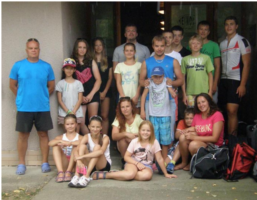
• V Piešťanoch.