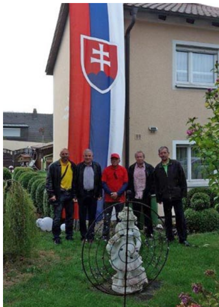
• Foto: Pod slovenskou vlajkou v nemeckom Regensburgu.