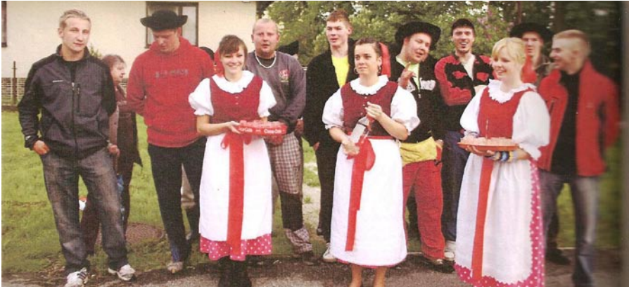
• Stavanie májov.