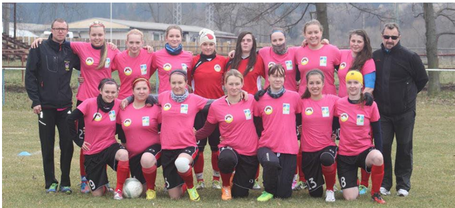
• Družstvo žien MFK Tatran Lipt. Mikuláš.

skému športu sa nevenuje až tak veľa dievčat. Úroveň ženského futbalu nie je až na takej úrovni ako je mužský futbal, pretože na všetko sú potrebné financie, ktoré nejdú tam, kde by mali ísť a mnohí ľudia ani nevedia, že ženy sa vôbec tomuto športu venujú a je to pre nich raritné až smiešne. Na začiatku, keď mikulášske ženy vošli do ligy, to nebolo najlepšie, ale postupne sa dievčatá vypracovali, prišli hráčky aj z tímov prvej ligy, ktoré začali chodiť v Mikuláši na vysoké školy a dal sa dokopy celkom slušný tím, ktorý spolu prežíva úspechy aj prehry.