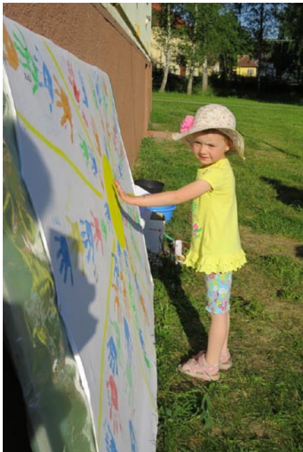
• Slnečný podpis