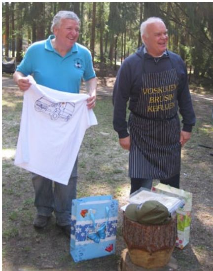
• „Odmenení“ tréneri.

Telovýchovná jednota Družba Smrečany - Žiar vás pozýva na