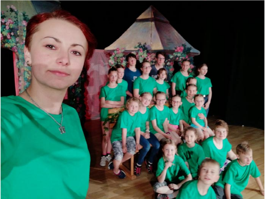
Počas Dňa detí