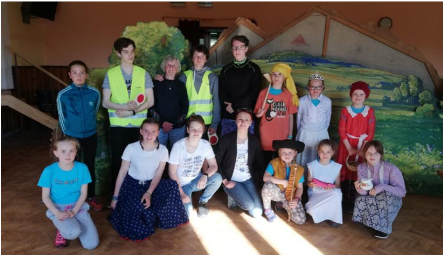
Divadelná mláď