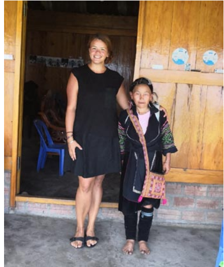
• So ženou z kmeňa Čiernych Hmongov v horách severného Vietnamu

Minulý rok som toho nestihla vidieť toľko, koľko som chcela, tak som