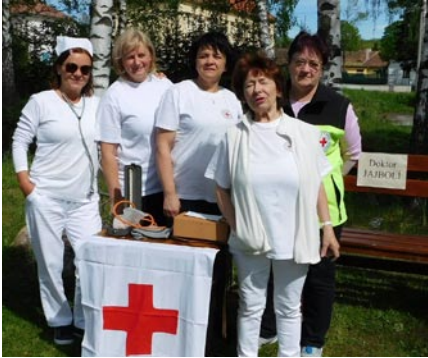
• Členky MSSČK počas Dňa detí