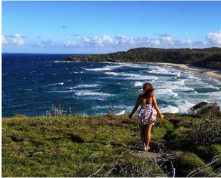
• Národný park Noosa, Austrália

Splnil sa ti aj tvoj veľký sen - navštíviť krajinu protinožcov. Naplnila Austrália tvoje očakávania?