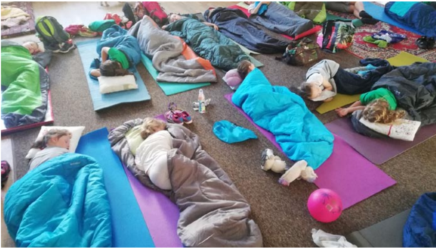
Ráno v Partizánskej Lupči