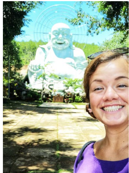
• Šťastný budha v meste Da Lat, Vietnam

Cestovanie mi dalo veľa. Rozhodnutie cestovať sama bolo asi to najlepšie, čo som mohla v poslednej dobe urobiť. Naučilo ma to veľa. Hlavne po-