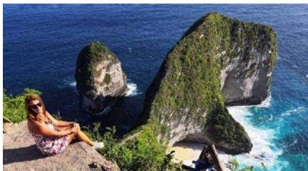
• Ostrov Nusa Penida, Indonézia

celý ich každodenný život. Vidate domácich v slávnostných odevoch kráčať s táckou plnou obetí ku oltáru, ktorý sa nachádza v každej domácnosti. Zapalujú vonné tyčinky, modlia sa, robia akési magické rituály, kropia obetiny vodou. To sa deje niekoľkokrát denne. Takmer každý deň majú spoločné ceremónie, kde spolu spievajú a modlia sa, k doktorom nechodia, liečia ich šamani, takisto veria na karmu. Celá atmosféra je silno spirituálna, no zároveň je to ostrov plný turistov, respektíve expatov, teda cudzincov, ktorí tam žijú a pracujú (väčšinou) online, čiže cez internet. Silná obľúbenosť a fluktuácia ľudí so sebou prináša aj problém, s ktorým bojuje celá naša planéta. Akurát niekde úspešnejšie a niekde menej. Odpad. Áno, 5 miliónov ľudí na ostrove Bali denne vyprodukuje až 3,5 ton odpadu. Indonézska vláda už zakázala používanie plastových tašiek a slamiiek a udelila turistickú daň, ktorá by mala byť použitá na čistenie pláží, no kým sa tieto opatrenia skutočne prejavia, ešte pár litrov kontaminovanej vody balískymi potrubiami pretečie. Ale aby som odpovedala na tvoju otázku, mojím najsilnejším zážitkom bol východ slnka na aktívnej sopke Rinjani na ostrove Lombok v Indonézii.