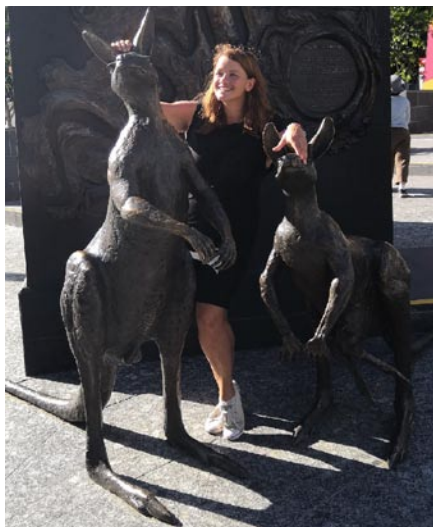
• Brisbane, Austrália

prácu ťahám na pleci a jediné, čo potrebujem je internetové pripojenie. Preto cestujem pomaly, zdržujem sa dlhšie na jednom mieste, kde sa snažím viesť taký ten normálny život, aký viem v Prahe alebo v Smrečanoch, čiže práca, šport, kamaráti, odpočinok. Nenaháňam sa za kultúrnymi pamiatkami ani atrakciami, stretávam sa s miestnymi ľuďmi, pýtam sa, ako žijú. Najkrajší je pocit, keď vojdete do kaviarne alebo reštaurácie a tam vás vítajú so slovami: „Welcome back, how are you today?“