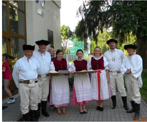
• Stavanie májov