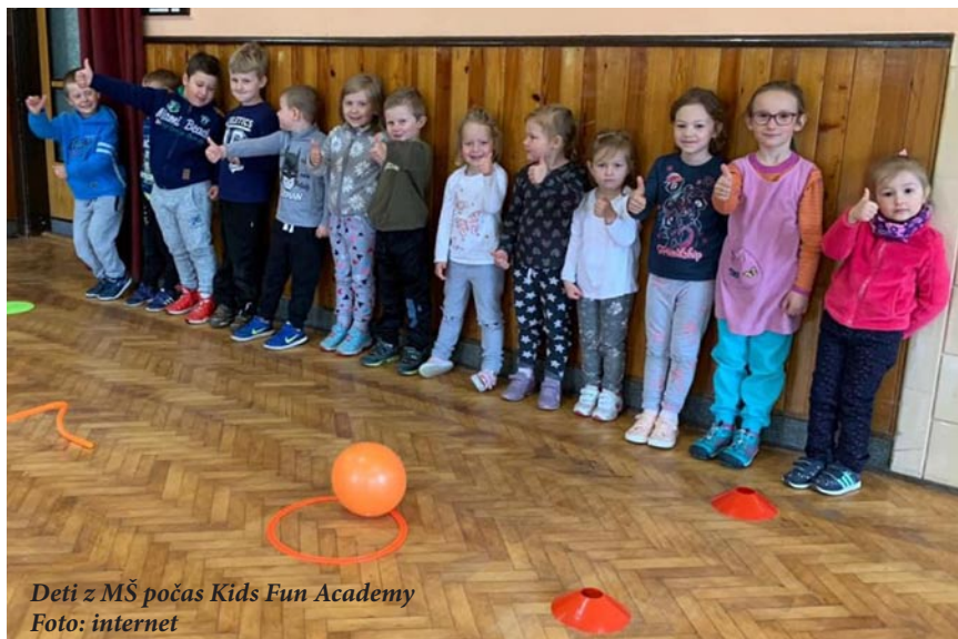
Deti z MŠ počas Kids Fun Academy

Obecné zastupiteľstvo zasadlo v uplynulom období raz, vyhodnotilo hospodárenie obce za predchádzajúci rok a schválilo záverečný účet za rok 2018. Podobne ako v predchádzajúcich rokoch, obec veľa preinvestovala, čo ovplyvnilo zvýšenie jej zadlženosti. Dlh obce sa však podstatne znížil