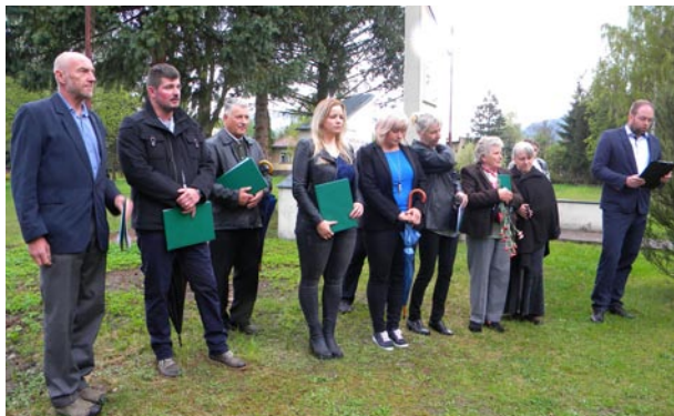
Pri spomienke na koniec 2. svetovej vojny

V tomto období sa naša folklórna skupina pravidelne stretáva pri nácvikoch nových programov a piesní, s ktorými by sme sa chceli predstaviť v budúcom období.