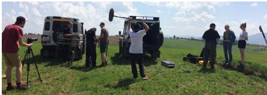
• Z natáčania dokumentu Nedotknuteľná zem

Na Festivale Áčko si prezentovala dokument Nedotknuteľná zem, ktorý