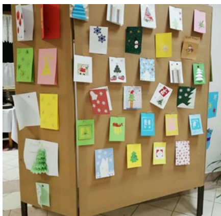
• Detské vianočné pozdravy