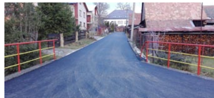
• Vynovená ulica.