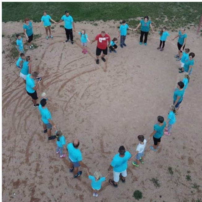
• Srdce rodičov a detí na vynovenom dolnom detskom ihrisku