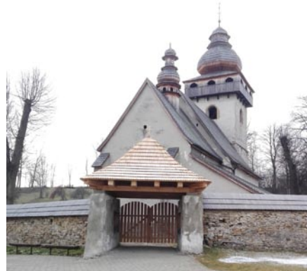
• Dokončené zastrešenie brány.