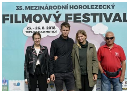
• Na festivalovej premiére filmu Na život a na smrť

sa natáčal aj v okolí našej obce, čo je jeho hlavnou témou?