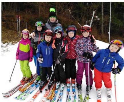
• Prvý tréning na Dolinkách, foto:-ju-

Všetko je pripravené na novú sezónu. Tešíme sa na vás na pretekoch, ktoré bude organizovať náš klub, na silvestrovskú lyžovačku alebo len tak pri krásnej obyčajnej lyžovačke. -mu-