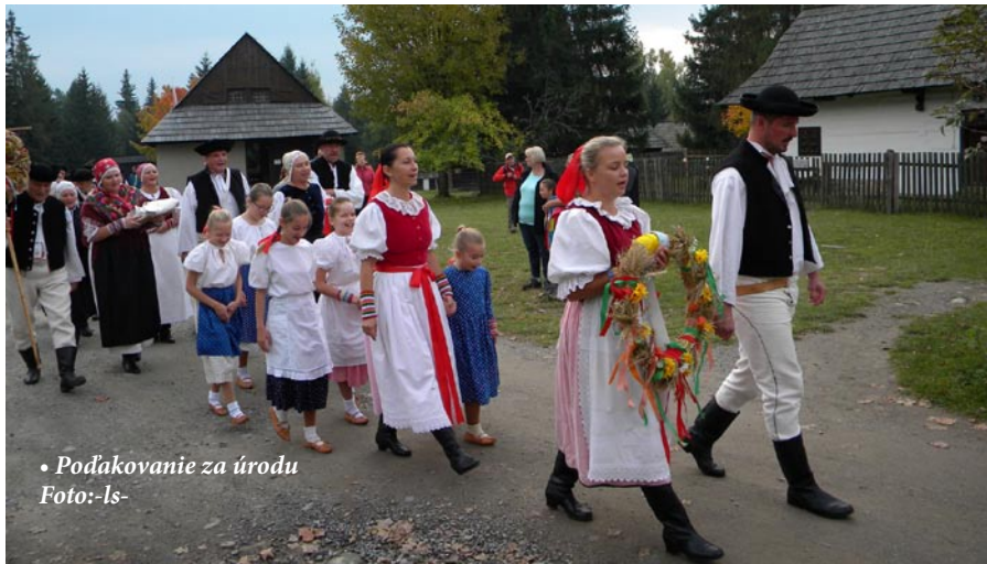
• Poďakovanie za úrodu

V Žiarskej doline sme si uctili pamiatku na symbolickom cintoríne tragicky zahynutých milovníkov našich hôr – Západných Tatier, ktorý sa každý rok rozrastá o tabuľky s menami zahynutých turistov, ktoré pripomínajú, aká je táto časť Tatier krásna a zároveň nebezpečná.