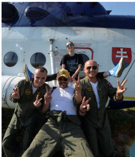
• S pilotmi, foto: -archív až-

Ono je ťažké povedať jeden zaujímavý zážitok a rovnako aj to, že je to