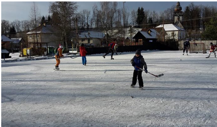
• Deti začali nový rok 2018 na obecnom klzisku pri KD.