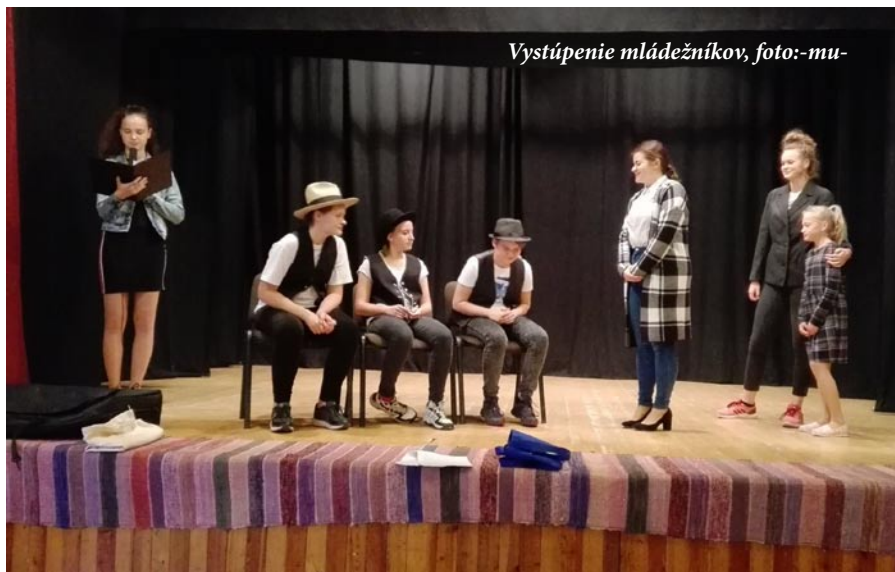
Vystúpenie mládežníkov