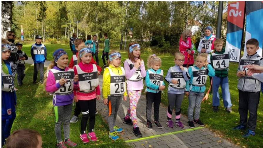
• Na štarte