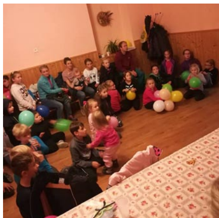
• Hry pre deti po sprievode