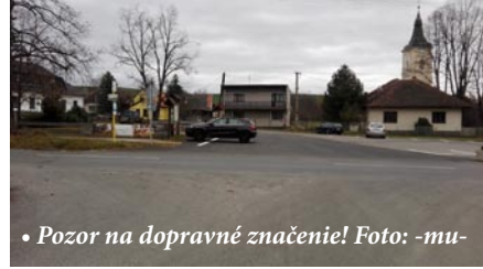
• Pozor na dopravné značenie!