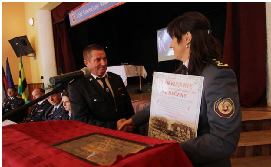
• Ďakovný list odovzdaný predsedovi DHZ Smrečany pri príležitosti 130. výročia vzniku dobrovoľnej požiarnej ochrany v obci