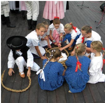
• Najmenší folklóristi