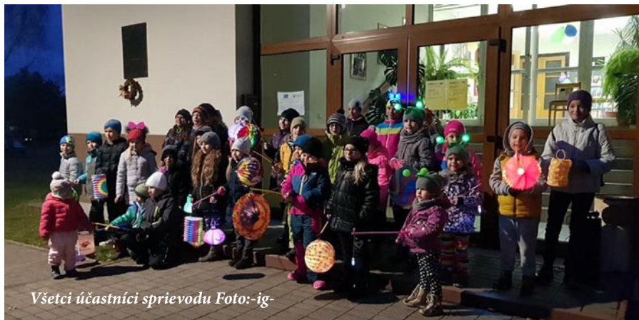
Všetci účastníci sprievodu

ých Smrečancov teraz zdobia vestibul obecného úradu.