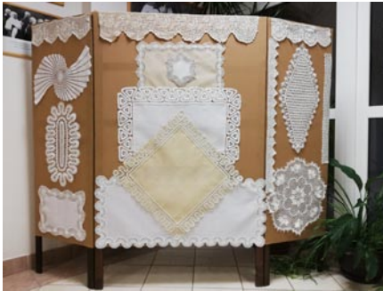
• Výstava háčkových dečiek.