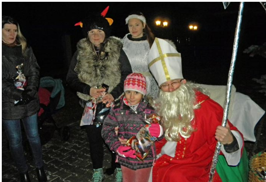
• Mikuláš so svojimi pomocníkmi doniesli balíčky pre viac ako sto detí. :-ls-