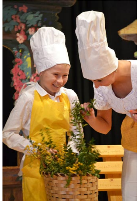
• Dve generácie hercov v jednej hre, foto: -jh-

Lampiónový sprievod sa v našej obci už pomaly stáva tradíciou, na ktorú celý rok nedočkavo čakajú malí, ale aj veľkí Smrečanci. Tentoraz sa konal