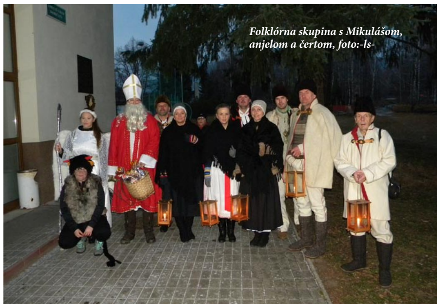
Folklórna skupina s Mikulášom, anjelom a čertom