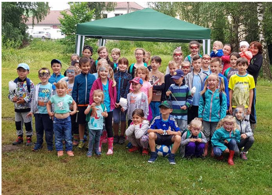
• Ani upršané počasie nezabránilo deťom usmievať sa na Dni detí.